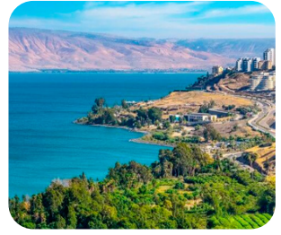
MAR DA GALILÉIA